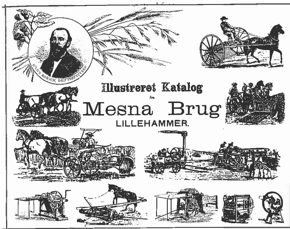
Mesna Brug var tidlig ute når det gjaldt å produsere nye maskiner til landbruket. Denne katalogen er fra 1885. (Utlånt av De Sandvigske Samlinger.)

Til omkring 1850 hadde det også vært mulig å få en del inntekter ved å selge korn. Helt siden 1816 hadde norsk korndyrking vært beskyttet av betydelige tollskranker. Men midten av århundret var tiden for den tradisjonelle liberalismens framvekst. Og omkring 1850 ble korntollen redusert til det halve. Dette var også tiden for de første dampskipene, og da de kom i bruk, ble det mulig å frakte korn, bl. a. fra præriene i Amerika til Norge både raskt og rimelig. Den innenlandske transporten var dårlig utbygd, og også det bidro til å gjøre det amerikanske kornet langt billigere enn det hjemlige. Det måtte derfor bety økonomisk ruin for den norske bonde om han skulle forsøke å konkurrere prismessig med det importerte kornet. Enda en faktor var at den importerte hveten viste seg å ha kvaliteter som det norske bygget manglet.