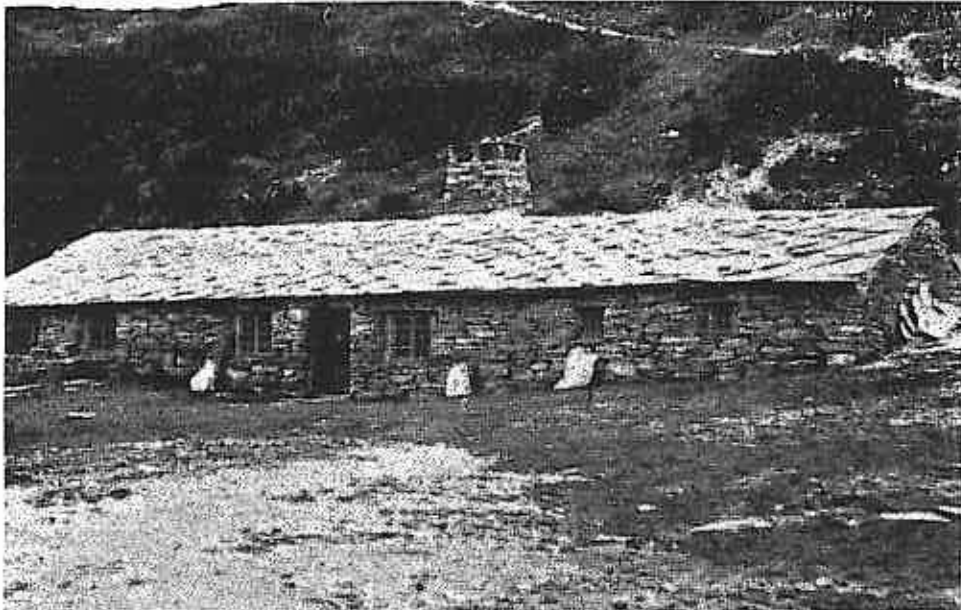
Landets første fellesmeieri i Rausjødalen i Tolga.

enkelte gard, men de fikk senere avgjørende betydning for de første fellestiltak.