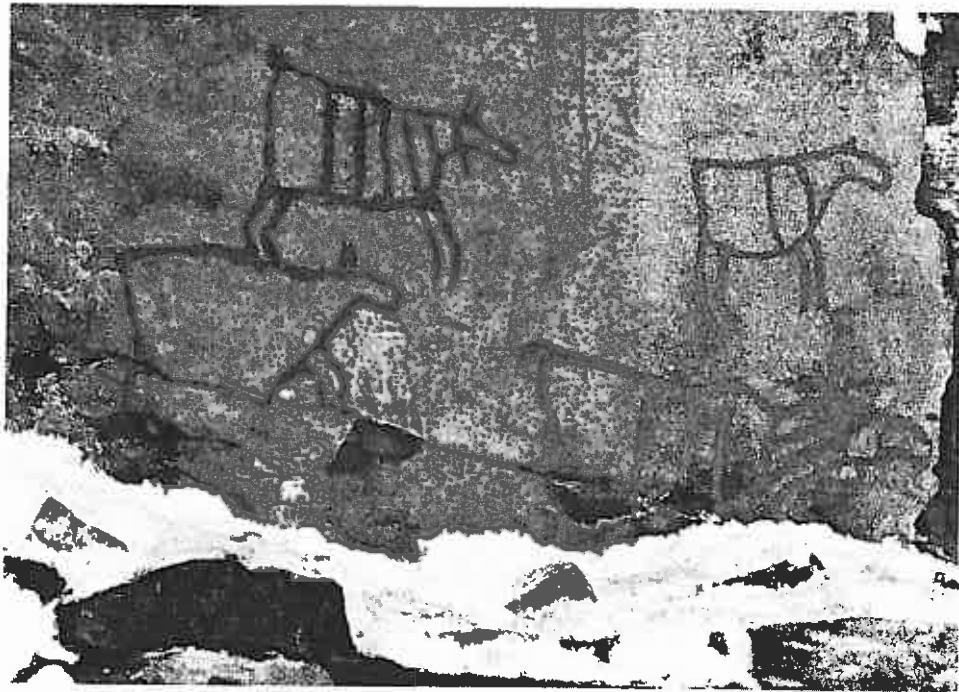
Helleristningene ved Drotten i Fåberg er det eldste merke etter mennesker i distriktet. De er ca. 4000 år gamle.

Det vi vet er at de første menneskene — her som andre steder — var jegere og fiskere. Det tok nok sin tid før jordbruket ble noen hovednæring iallfall, selv om de første kunnskaper om jordbruk trolig kom til landet vårt sørfra omkring 4000 f. Kr.